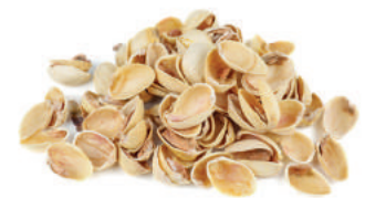
Restos de frutos secos