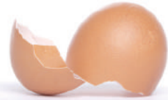
Cáscaras de huevo