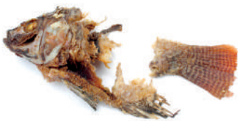
Restos de pescado