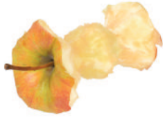
Restos de frutas