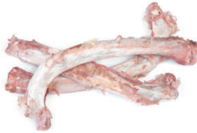
Restos de carne