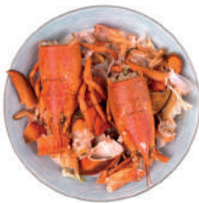
Restos de marisco