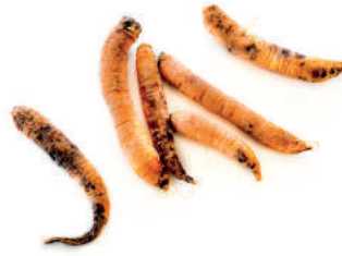
Restos de verduras