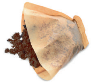
Posos de café e infusiones